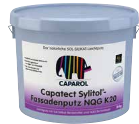
Capatect Sylitol®-Fassadenputz NQG Der natürliche SOL-SILIKAT-Leichtputz